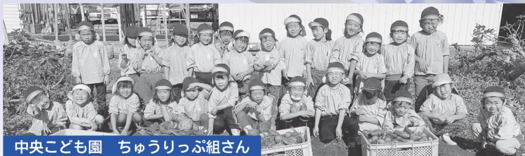
中央こども園 ちゅうりっぷ組さん