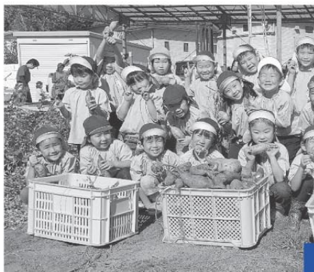
中央こども園 すみれ組さん