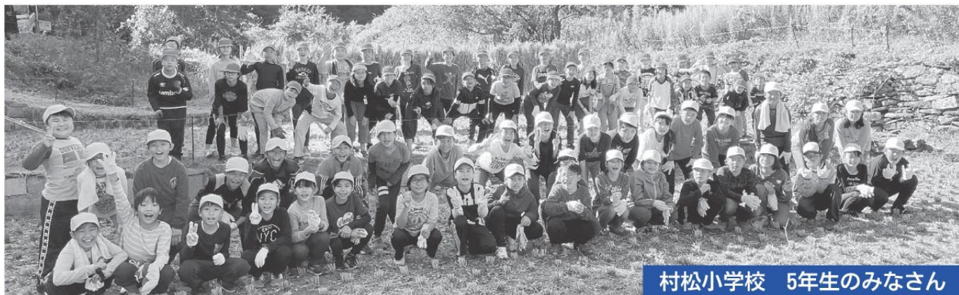
村松小学校 5年生のみなさん