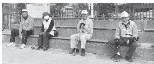
グラウンド・ゴルフ 琴海南部クラブのみなさん