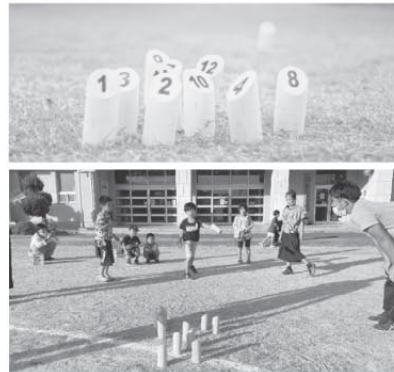
主催: モルック長崎 (ながさき若者会議)

琴海地区の情報を掲載希望されるかたは、LINEでも受付ますので、こちらからお願いします。