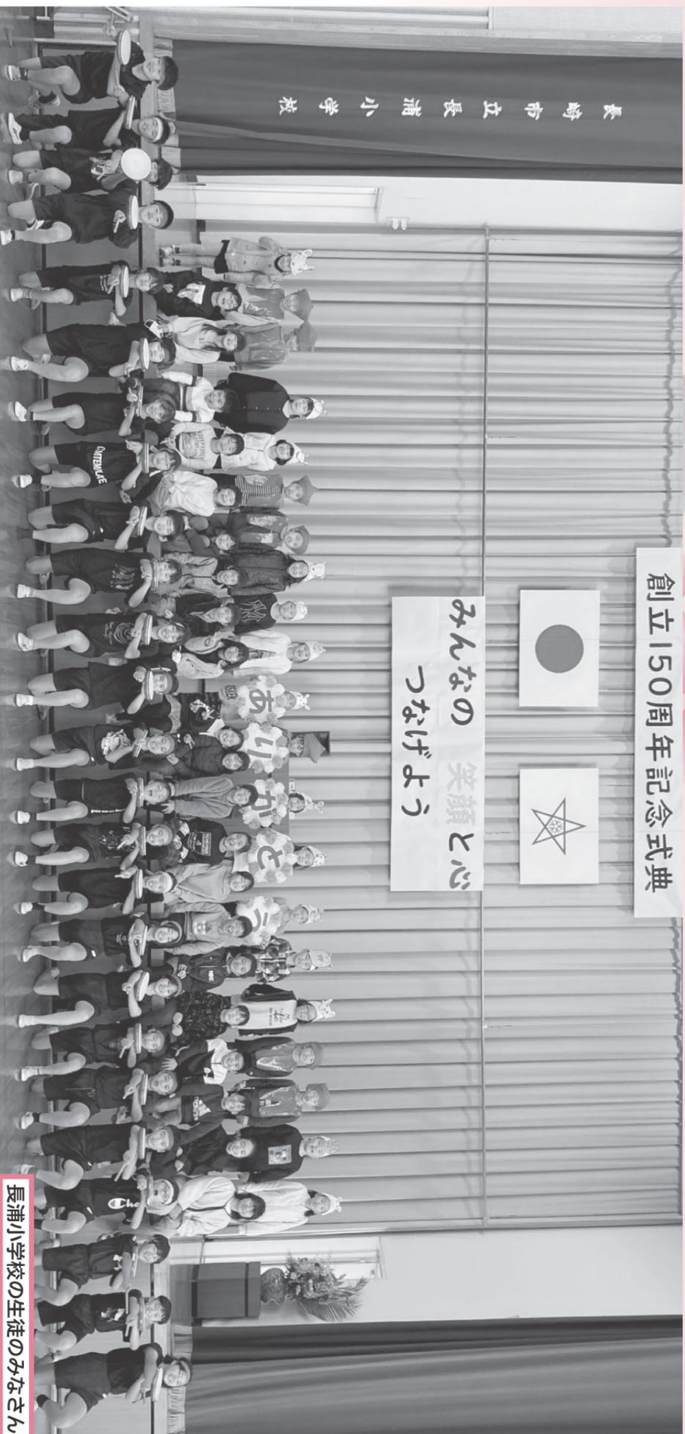
長浦小学校の生徒のみなさん

11月28日(日)に、長浦小学校体育館で開催された「長浦小学校創立150周年記念式典」にお邪魔しました。長浦小学校の前身は、明治4年9月、長浦郷校として庄屋宅で開学されたのがはじまりで、明治6年に、現在の長浦事務所の場所に2階建校舎を建て長浦村の英才を集めていきました。それから明治43年に形上と合併し、小島の浦に校舎を新築移転しました。昭和28年には長浦と形上の両小学校に分割し、長浦のテニスコートの場所に移転されました。現在の長浦小学校の校舎は、昭和61年に再び移転新築されたものです。150歳の誕生日を迎えた小学校は、長崎市で長浦小学校が一番目になります。本校を卒業したという方も多数いらっしゃるかと思いますが、過去から現在、今もなお、「長浦っ子」は、地域の方々の温かいご支援を受け、風光明媚な自然と豊かな体験活動を経験し、のびのびと学校生活を送っています。記念式典でもごもたちの元気な笑顔と声がかんなの心に届きました。今回ご出席できなかったみなさんに長浦小学校のごもたちの笑顔をお届けします！！