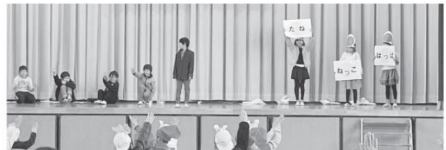
3年生 笑顔でできた長浦スイカ 長浦スイカのはじまりは奈良県のたねから