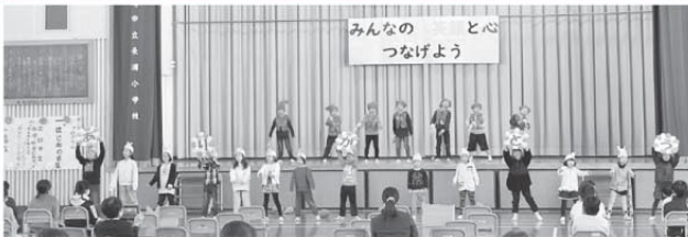
1・2年生 音読劇「おもいがころりん」朝長さんのおもい畑に感謝