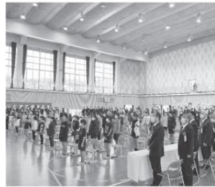
記念式典の様子(長浦小学校体育館)