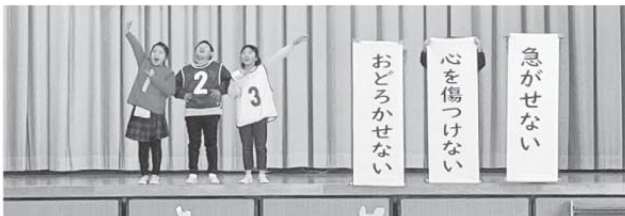
4年生 福祉について ～普段の暮らしの幸せとは～ 困った人がいたら…