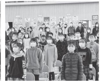
校歌斉唱する長浦小のこどもたち