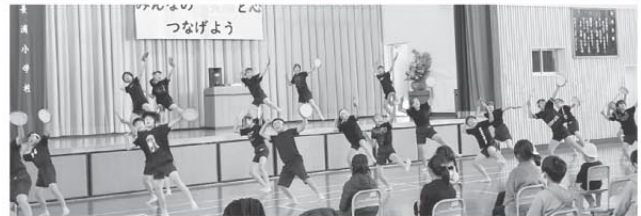
5・6年生 沖縄舞踊エイサー ～誓け！郷土への熱き魂(おもい)～