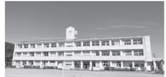
快晴の下、長浦小学校にて

式典後には、保護者のかたや日頃からお世話になっている地域の方々への感謝の意を込めて、児童による発表の場が設けられました。琴海といえば『長浦スイカ』と誰もが連想するスイカの起源(ルーツ)が、当時スイカの産地で有名であった奈良県の農家のかたから分けていただいた『タネ』が現在に至っていることを劇を交えて発表しました。最後に、5・6年生全員で沖縄舞踊エイサーを披露し、長浦を愛する熱き魂が会場にいるみなさんの心に響きわたり、お祝いの場を更に盛り上げていました。