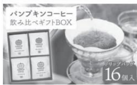
自家焙煎珈琲 パンプキン