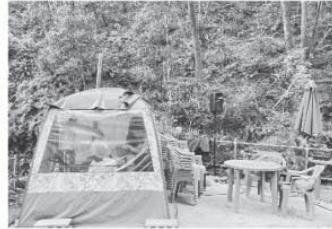
サウナー注目の『テントサウナ』が体験できます！