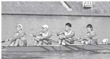
第71回全日本社会人選手権大会 男子舵手付きフォアB1000m 優勝