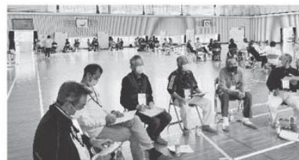
第2回よ～いさあ～ながうら(話し合いの場)の様子