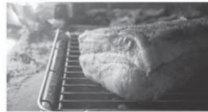
ボリューム満点の豚肉と焙煎したコーヒーに舌鼓