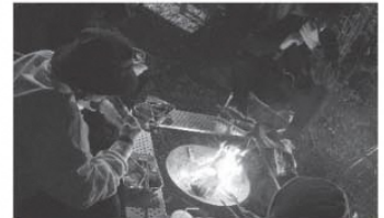
焚き火を囲んでキャンプ料理に挑戦