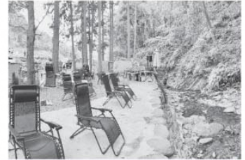
戸根川上流にある「清流と棚田の里」で森林浴