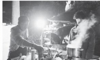
豚肉料理のお店missi(長浦町)さんが料理を監修