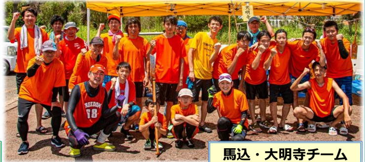
馬込・大明寺チーム