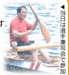
▲当日は選手兼司会で参加

皆さんこんにちは。この記事を目にするのは夏が終わりを迎える頃かと思います。私がこの夏一番印象に残っているのは「夏祭り！伊王島ペーロン大会」です。台風上陸が心配される中でしたが、天候にも恵まれ開催することが出来ました。4年ぶりの開催で、皆さんがこの日が来るのを楽しみにしている姿を見ることができて本当に嬉しく思いました。そして私自身、人生で初めてペーロンに乗りました。船津チームの一員として一週間の練習にも参加しましたが、激しい運動で全身が熱を帯びて毎晩夜中に目が覚めてしまい「おお、脂肪が燃焼している」とペーロンの運動量の多さを痛感しておりました。でも残念ながら、練習後の打ち上げがあまりにも楽しすぎて体重は1キロも減りませんでした（泣）。本当に楽しかったのですが、終わった時に「ああこれで終わるんだ」という寂しさを感じました。と同時に、だから翌年も集まるんだ。だからきつくても練習に来るんだ。だからみんながペーロンを大事にしているんだ。私が触れたのはたったの1週間でしたが、ペーロンでつながる皆さんの輪の中に入れたことで、伊王島の方々がペーロンを大切にしている気持ちが少しだけ分かったような気がしました。今から来年が楽しみです。そして、来年は船から落ちないように気を付けます（笑）。