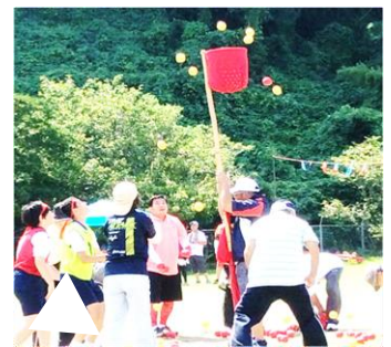
▲令和元年度開催の様子