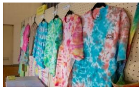
多彩な作品の数々に見入ります