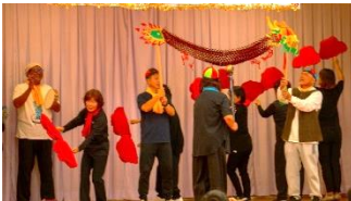
ステージ発表では全員で合唱も！