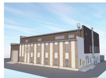
▲訓練棟のイメージパース