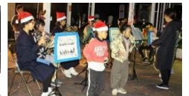
青潮学園吹奏楽部