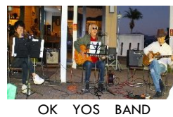
OK YOS BAND