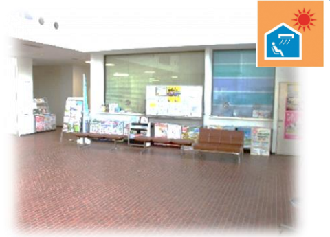
▲伊王島地域センター1階ロビー

開放日は熱中症特別警戒アラート発表期間中の平日(土・日・祝除く) 8時45分から17時30分です。アラートが発表されていなくても暑さをしのげる場所としてご利用ください。