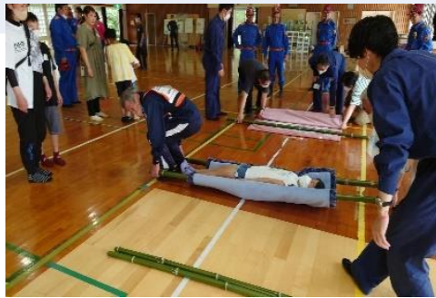
毛布と竹2本で担架作り