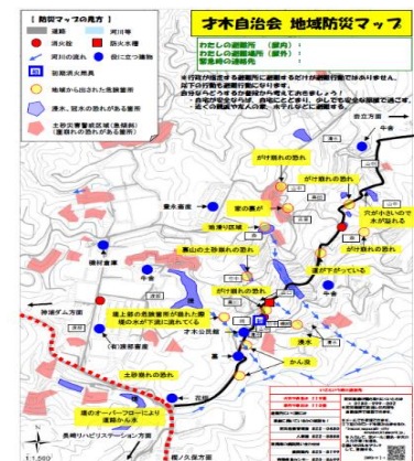
<ささえあいマップの一例>