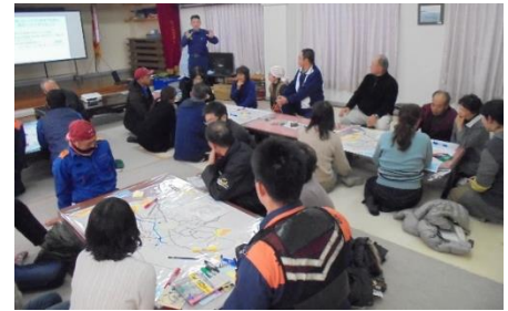
【地域防災マップ作成の様子】

いざというとき、地域に住むみなさん自身が、地域の防災情報を共有して、災害時にあわてず冷静にすばやく適切な対応ができるように備えることが大切です。災害時の重要な情報源として、また普段から地域防災を考えるうえで利用されるのが「 地域防災マップ 」です。一人一人が知っている情報を出し合い、地域の実状を確認しあいながら、その地域に合った「地域防災マップ」を作ってみませんか。