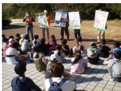
【環境学習会の様子】

当日は、派遣された県環境アドバイザーが、「プラスチック製レジ袋有料化」のきっかけの一つとなった、近年問題となっている「海洋プラスチックゴミ」による汚染の実態を子ども達に分かりやすく説明を行い、その後、保護者も参加し約50名で海岸清掃を行いました。わずか1時間の清掃でしたが、用意したゴミ袋50枚があつという間にいっぱいになるほどのゴミが収集されました。それでも、海岸にはまだまだプラスチックゴミが残っていました。