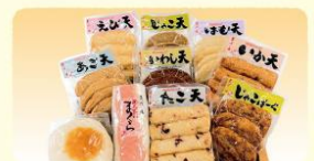
新鮮な魚のすり身を一晚掛けてじっくり 熟成させた「かまぼこ」