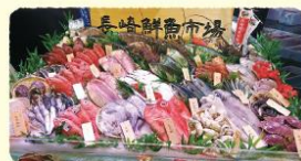
日本一豊富な魚種を誇る!! 三重は「刺身」が美味しいまち