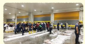
漁港水揚げ全国3位の「新長崎漁港」