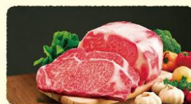
日本一に輝いた「長崎和牛 出島ばらいろ」