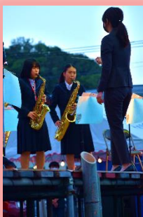
長崎明誠高校吹奏楽部の演奏