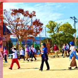
健康遊具を使った運動