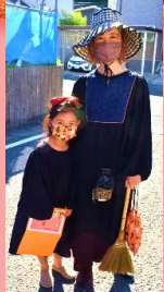
ご家族でおしゃれ!