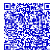
三重・外海・琴海の食と見どころ

今後も三重地域の様々な活動やイベントを取材させていただきますので、ご協力をよろしくお願い申し上げます。併せて、情報提供もお願い申し上げます。