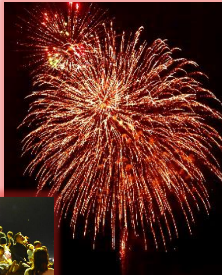
みんなで花火を眺めると楽しいね♡