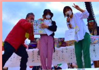
ビンゴ大会は大盛り上がり!