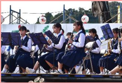
三重中学校吹奏楽部の演奏

10月22日(土)長崎漁港前の広場において三重外海琴海まちづくり実行委員会主催の秋祭りが開催され、ステージイベントや打ち上げ花火、いろんな出店で大盛況でした。