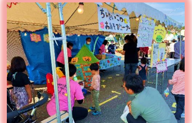
子育て支援センター「てとて」のお遊びコーナーも大賑わい