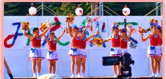
ダンスと新体操は元気いっぱい!