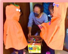
合言葉を上手に言えました!