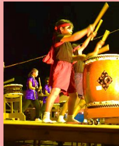
伝統のにしうみ太鼓!