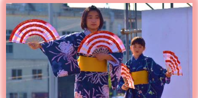
三栄子ども会の美しい民踊