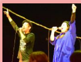
レインボーミュージック