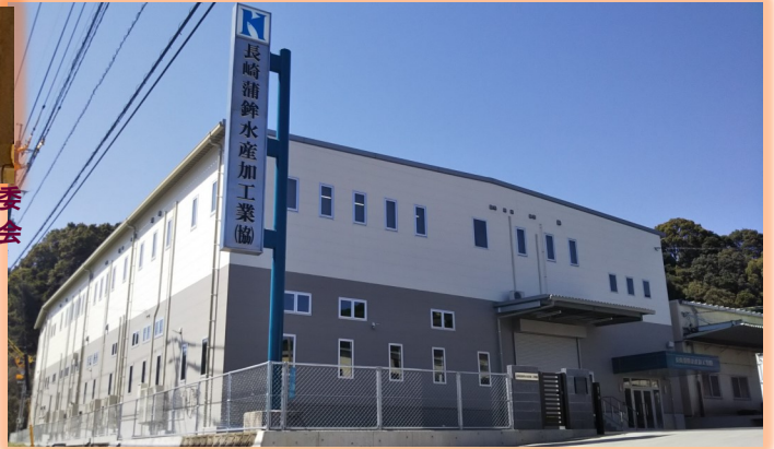
長崎蒲鉾水産加工業協同組合様(京泊3丁目)