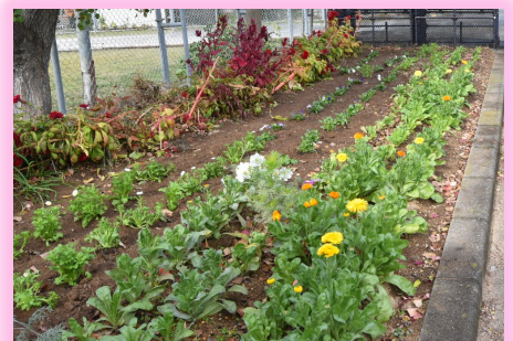
畝刈第4公園グラウンド前