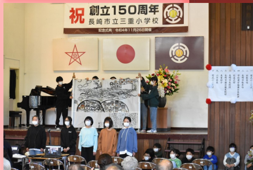
6年生の発表の様子