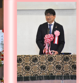
地域の方々も出席されていました