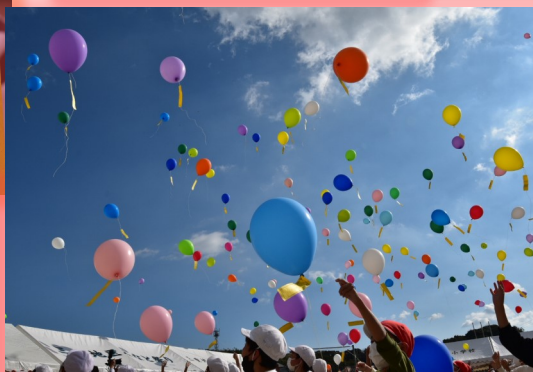
風船に夢や願いを込めて「バルーン・オン・ザ・ドリーム！」