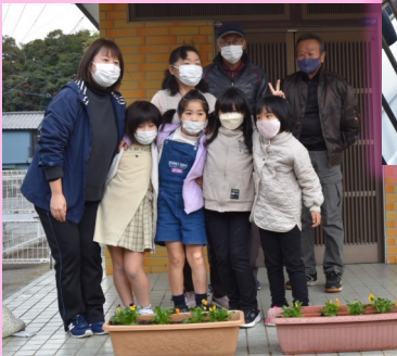
京泊公民館にもきれいなお花が咲いています。