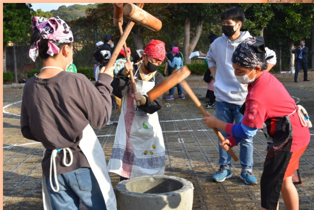
子どもたちのもちつきの様子。