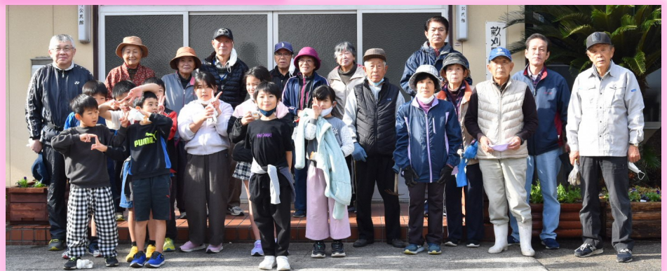
畝刈公民館は笑顔と元気が溢れていました。「花いっぱい」になりました。