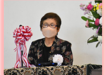
学校運営協議会会長・柏木様