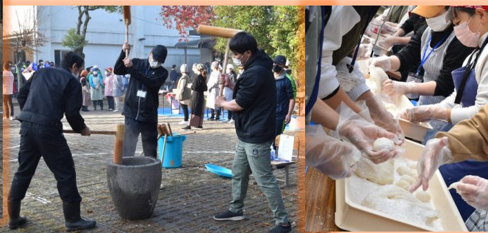
育友会の方々が大活躍でした。