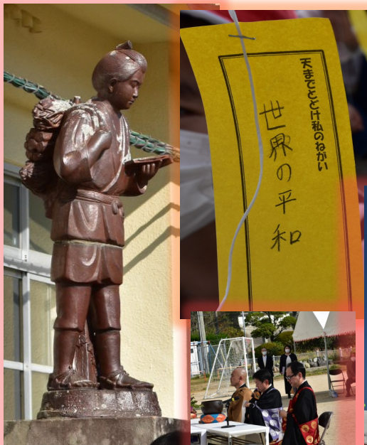
移転された二宮金次郎像