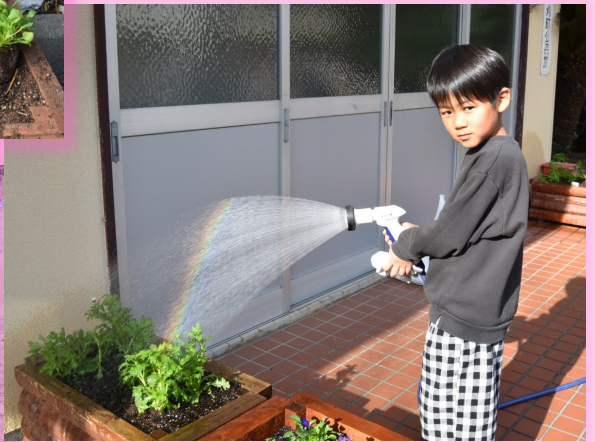
上手に植えることができました。満開が楽しみです。