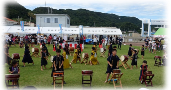
(平成30年度のまつり開催風景)