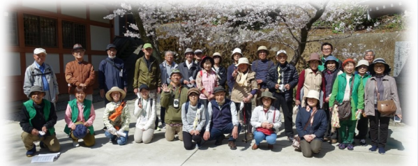
(令和3年度の歴史さんぽ)

これからも様々な分野で、「 老いも若きも手をつなぎ 未来へはばたく福田 」の実現に向けて活動されますので、皆さんのご協力をよろしくお願いいたします。