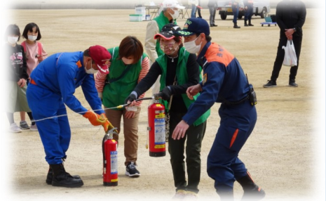
(令和3年度の防災訓練)

協議会は、安心安全できれいなまちを目指す「 自然環境・防災部会 」、歴史や伝統を学ぶ機会と活動に取り組む「 歴史・伝統部会 」、子どもから大人まで明るく元気で笑顔あふれるまちを目指す「 きずな部会 」、福田っ子を地域で守り子どもも高齢者も安全で暮らしやすいまちを目指す「 生活環境・交通部会 」の4つの部会と全体の取りまとめを行っている事務局で構成しています。