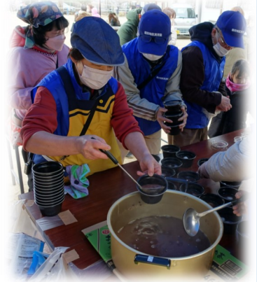
(令和4年度の開催風景)