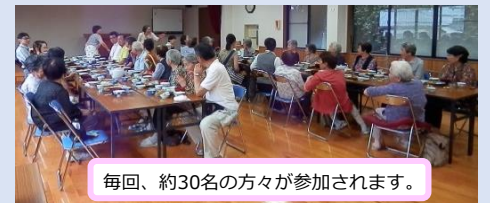
毎回、約30名の方々が参加されます。

昼食会の後に行われる催し物も実に様々。地域の方々による民謡、浦上警察署による高齢者を取り巻く犯罪・事故等への注意の呼びかけ、もとお保育園の園児や坂本小学校児童による催しなど。もちろん長崎大学学生の皆さんも認知症予防のゲームなどを行います。参加者の皆さんは「毎回楽しみ」と笑顔で話されていました。社協支部、学生、参加者の皆さん全員が楽しみながら活動していることが印象的なふれあい昼食会。これからも“地域で顔が見える関係”を築いていこうですね。