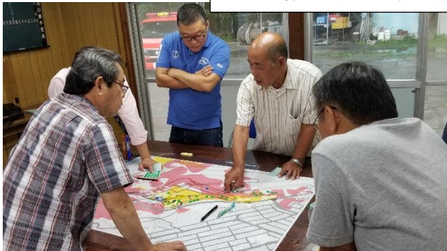
当日の様子(2 つの班に分かれての防災マップづくり)

このように、大きな自然災害が起きる前に避難方法や近隣住民のことを把握しておくことはとても大切なことです。また、周辺環境は常に変わっていきます。定期的な防災マップづくりの見直しを行いましょう！！