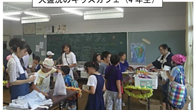
大盛況のキッズカフェ(4 年生)