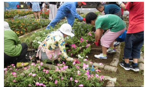
当日の様子：植え付けの真っ最中

大先輩方に植え付け方法を教えてもらいながら行い、賑やかなひと時となりました。小ヶ倉公園花壇も 6 月 19 日(火)に自治会の方々によって、雨の中、植え付けが行われ、どちらも花壇はともきれいに仕上がり、素敵な場所になっています！