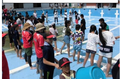
当日の様子：みんなでバケツリレー