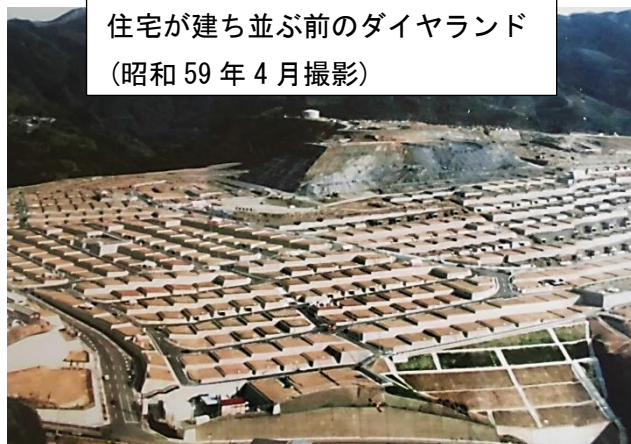
住宅が建ち並ぶ前のダイヤランド (昭和 59 年 4 月撮影)

(ダイヤランドは昭和 59 年(1984 年)に団地が誕生し、今年で 34 年を迎えます。)