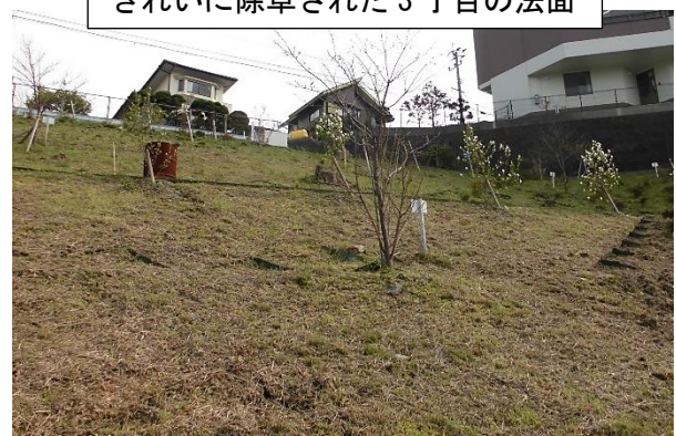
きれいに除草された3丁目の法面

長崎市においては、このアダプトプログラムを平成13年度から事業を開始しています。興味のある方、詳しく知りたい方は、廃棄物対策課(☎829-1159)へお尋ねください。