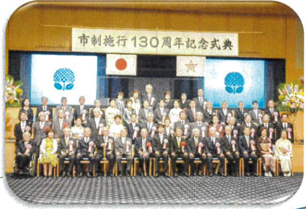
平成31年表彰者の皆さん