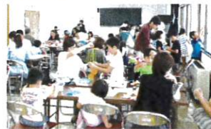
(親子で工作する様子)