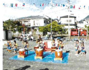
(第三自治会夏祭りの様子)

7月28日(日)に大山町自治会、8月3日(土)にダイヤモンド第二自治会、10日(土)にダイヤモンド第三自治会で夏祭りが開催され、大変賑わいました。そのほか、17日(土)にダイヤモンド第四自治会ではビンゴゲーム・花火が行われ、18日(日)には上揚自治会でソーメン流しなど、各自治会が工夫を凝らし開催されました。子どもたちは、夏休みの楽しい思い出になったと思います。