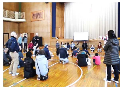
(レクリエーションの様子)

「私はだあれ」「人間じゃんけん」「フルーツバスケット」など体や頭を使うゲームを行いました。子どもたちは体育館の中を動き回り、大変楽しんでいました。