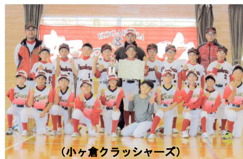
(小ヶ倉クラッシャーズ)