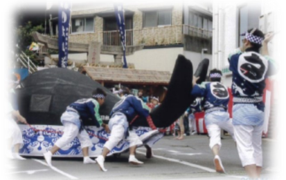
(小ヶ倉くんちの「くじら舟奉納」)

小ヶ倉くんちでは、4年に一度の踊り町を務め、地区内の住民総出で「くじら舟」を奉納しており、迫力ある演技が大変好評です。「くじら舟」は、住民間の強い絆になっています。