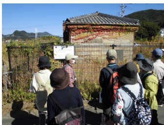
国際海底電線小ヶ倉陸揚庫 (小ヶ倉町3丁目)での様子

参加者の皆様は、歴史豊かな小ヶ倉のまちを歩きながら、当時の様子に思いをはせられたのではないのでしょうか。