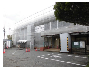
正面玄関側からの様子