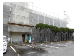
裏側駐車場からの様子