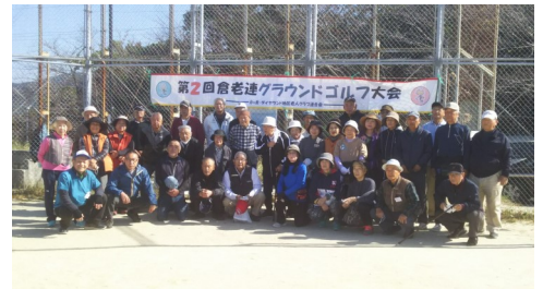
参加者と役員の皆様

当日は天候にも恵まれ、4つのクラブから31人(男性18・女性13)の参加者があり、親睦を深め合いながら、皆さんプレーを楽しんでいました。