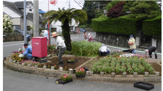
(ロータリーでの作業の様子)

年2回、夏と冬に花苗の植え付けを行っていらっしゃいますので、いつも綺麗な花壇を楽しむことができます。近くを通られる際には、ぜひ花壇をご覧ください。