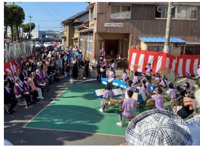
(踊場と観客でいっぱいの観覧席)