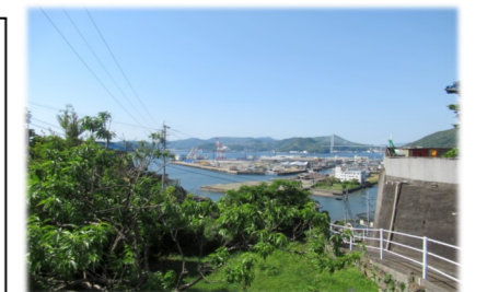
▲(今月の1枚)三和上地区からの風景