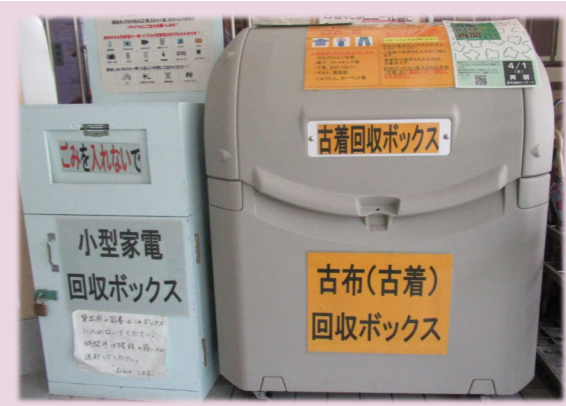
▲合同庁舎入口に設置しています！

両方とも合同庁舎の入口にボックスを設置しています。土日でも利用できますので、ぜひご利用ください。