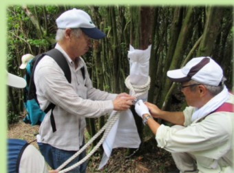
▲ロープや看板の設置、維持管理など行います！