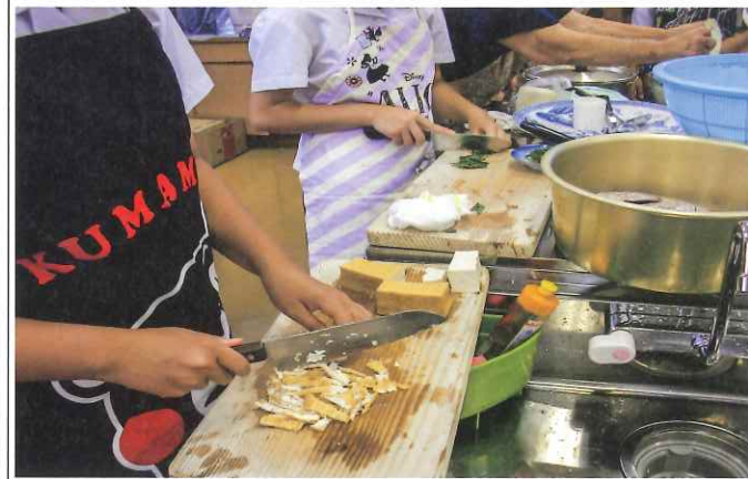
上、婦人会の指導を受けながら馴れない包丁さばき 下、出来上がりは最高の鯛ソーメン

深堀の移り行く歴史を、半世紀にわたり見つめてきた建物がひとつ、またひとつと姿を消してゆくことには忍びない寂しさを覚えますが、近隣の方々に風災害などで思わぬ被害を出さないためにも、これまでの活用に、心からの感謝をしつつ解体とさせていただきます。(深堀地区連合自治会)