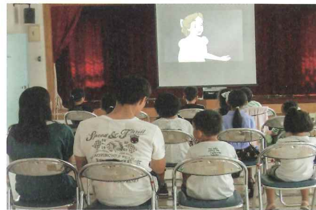
上、ピーターパン映画会 下、講師の先生と「楽しく歌いましょう」

この他にもケーキ作りや七夕飾りなど夏休みは青少年向けの講座をたくさん開催しています。来年はぜひ参加してください。