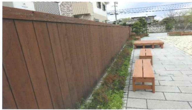
各自治会の見守りイメージ

深堀地区では年間を通して様々な活動をしています。深堀を、楽しい街にするのもつまらない街にするのも、私たち一人一人の心の持ちようです。