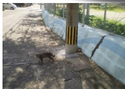
猫にも癒されます