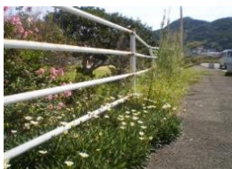
お花に癒されます☺