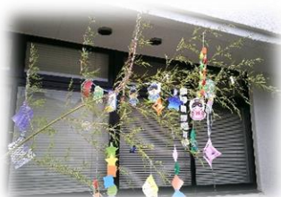
地域センター七夕飾り