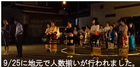
9/25に地元で人数揃いが行われました。