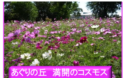
あぐりの丘 満開のコスモス (10/23撮影)

吹く風もめっきり涼しくなりました。秋と言えばスポーツの秋、読書の秋などありますね。皆様はどんな秋を過ごされますでしょうか？