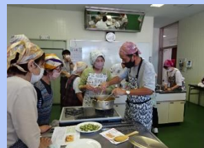
白ゆり会の皆さんほか