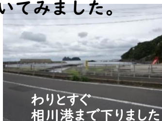
わりとすぐ相川港まで下りました