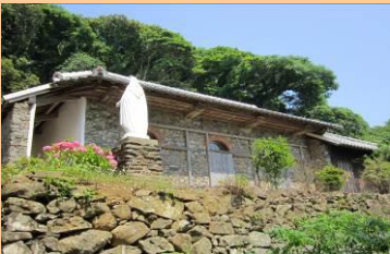
ド・ロ神父が考案した石積の教会 県指定有形文化財指定