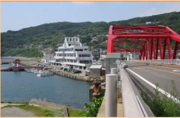
外海ふるさと交流センター(神浦郵便局前バス停から撮影)