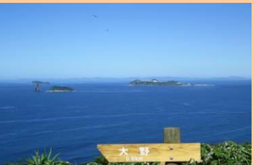
五島灘の景観です。雄大な景色に心が洗われます。