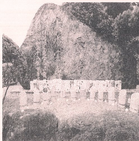
7月18日 日見地域センター内慰霊

今年は、日見小学校5年生が『八郎川慰霊の灯実行委員会』の皆さんによる防災授業を受け、地震や雷、水害などの恐ろしさを知るとともに、突然やってくる災害時に、どのような行動をとるかを考え、追悼の祈りを込めて牛乳パックで灯籠を作製されました。7月18日の夜には、その灯籠に明かりを灯し慰霊碑を飾りました。