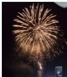
<夜空を彩る迫力の花火>