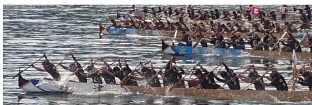
<長崎ペーロン選手権大会 決勝戦>

当日は、地元の皆さんがたくさん応援に来てくださいました。ありがとうございました。