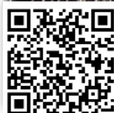
<花火動画が見れます！>