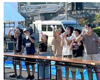
<ラムネ早飲み競争>