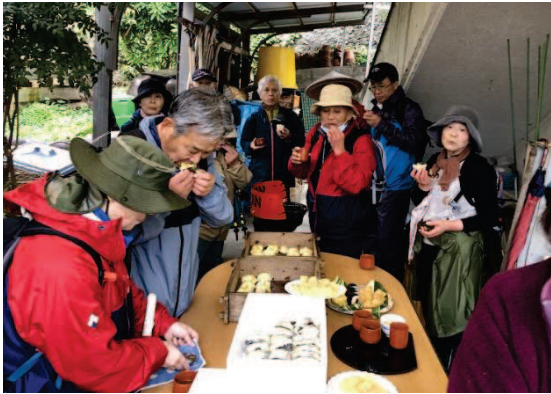
お接待の様子 手作りの饅頭、芋団子、おにぎり、巻き寿司など美味しくいただきました。

北浦コースは山の上にある84番と85番の超難所があり、皆さん助け合いながら頑張って回ることができました。