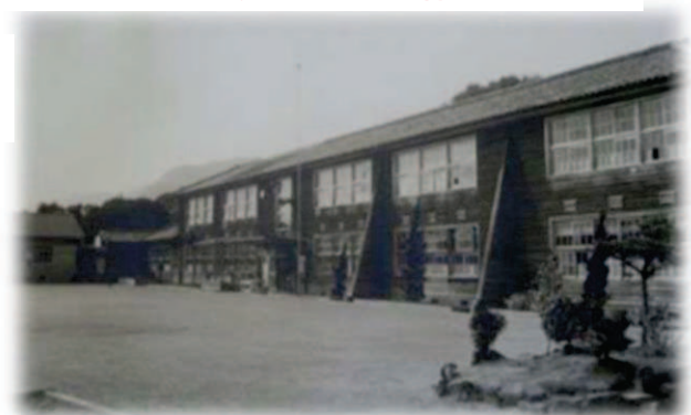
昔の校舎(年代不詳)