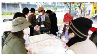
みんなで餅を丸めています

当日は多くの住民の方々が参加し、子どもも一緒に餅をついたり丸めたりしました。出来上がった餅は各家庭に配られ、みなさん喜んでいました。