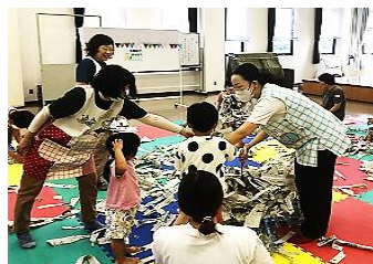
楽しく遊んでいる講座の様子

♪「近くに子どもがいない」「友達 が欲しい」「育児についていろ いろ知りたい」と同じような思い をお持ちのお母さん、お子さんと 一緒にお越しください♪