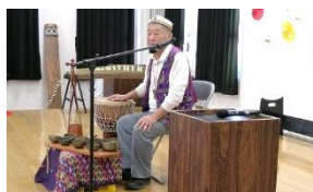
サマディー9(民族楽器)