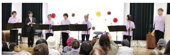
さわやかオカリナ(オカリナ)