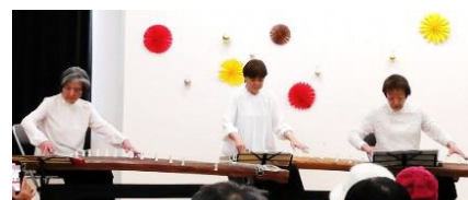
トライアングル(箏)