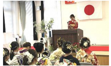
昨年の式典の様子

日吉自然の家 マルシェ きさろぎゆうかく 第6回 如月遊楽 2/2(日) 9:30~16:00