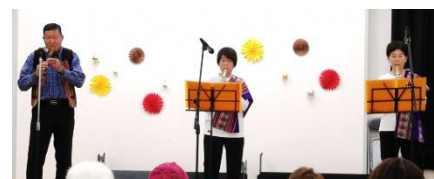
ケーナの会(ケーナ)