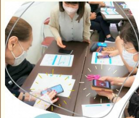
はじめてのスマホ