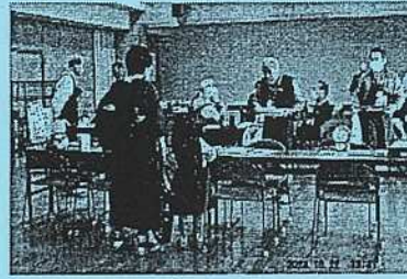
長崎おもちゃ病院