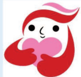
犯罪被害者等支援シンボルマーク「キュットちゃん」

犯罪被害者等の置かれている状況等について理解を深めることを目的に、全国で啓発事業が行われています。