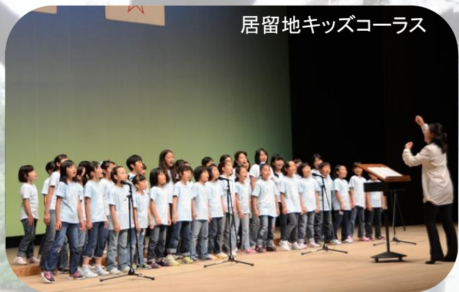
居留地キッズコーラス

居留地キッズコーラスによる合唱を行いました。居留地キッズコーラスは、大浦小学校の3年生から6年生の子ども達で結成されており、集会にふさわしい曲とメッセージを披露していただきました。