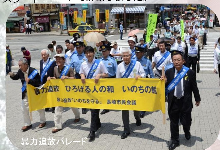
暴力追放パレード

暴力追放パレードは、長崎市公会堂を出発し、長崎市役所前、長崎家庭裁判所前をとり、浜市アーケードで解散しました。