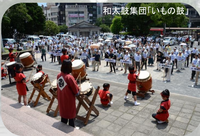
和太鼓集団「いもの鼓」

パレードの前に、和太鼓集団「いもの鼓」による、和太鼓演奏を行いました。幼稚園から小学校高学年までの子ども達によるすばらしい演奏が披露されました。併せて、パレード出発時には、威勢のよい太鼓で送り出してくれました