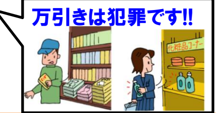
万引きは犯罪です!!

○盗む際のスリルを楽しむために万引きする例が多いようです。高齢者が犯人の場合も多く、非常に残念なことです。