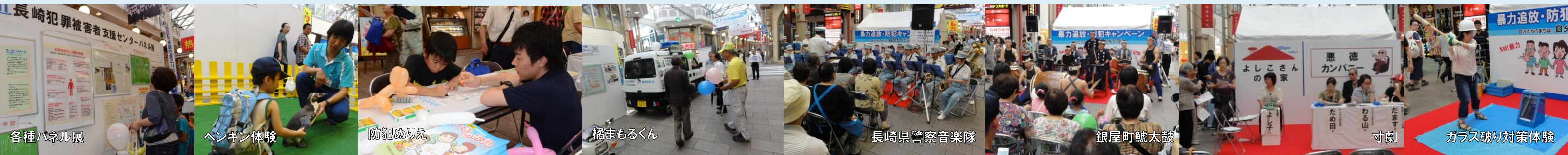
各種ハネル展 ペンギン体験 防犯めりえ 橘まもるくん 長崎県警察音楽隊 銀屋町鯨太鼓 寸劇 ガラス破り対策体験

市民の皆様におかれましては、暴力追放・防犯の取り組みについて学んでいただいたことを活かして、「自分たちのまちは、自分たちで守る」という自主防犯意識を高めていただければと思います。 なお、平成25年4月20日(土)に公会堂において午前10時から暴力追放「いのちを守る」長崎市民集会を開催します。ぜひご参加ください。