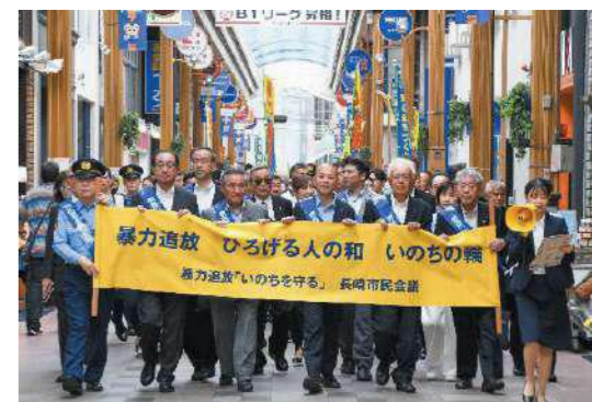
▲ 暴力追放パレード

ここ数年は新型コロナウイルス感染拡大の影響により、総会後のパレードを見送ってきましたが、4年ぶりに暴力追放パレードも実施。市役所前から浜町アーケードまで横断幕を持ちながら行進し、暴力追放を呼びかけました。