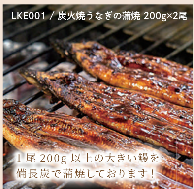
LKE001 / 炭火焼うなぎの蒲焼 200g×2尾