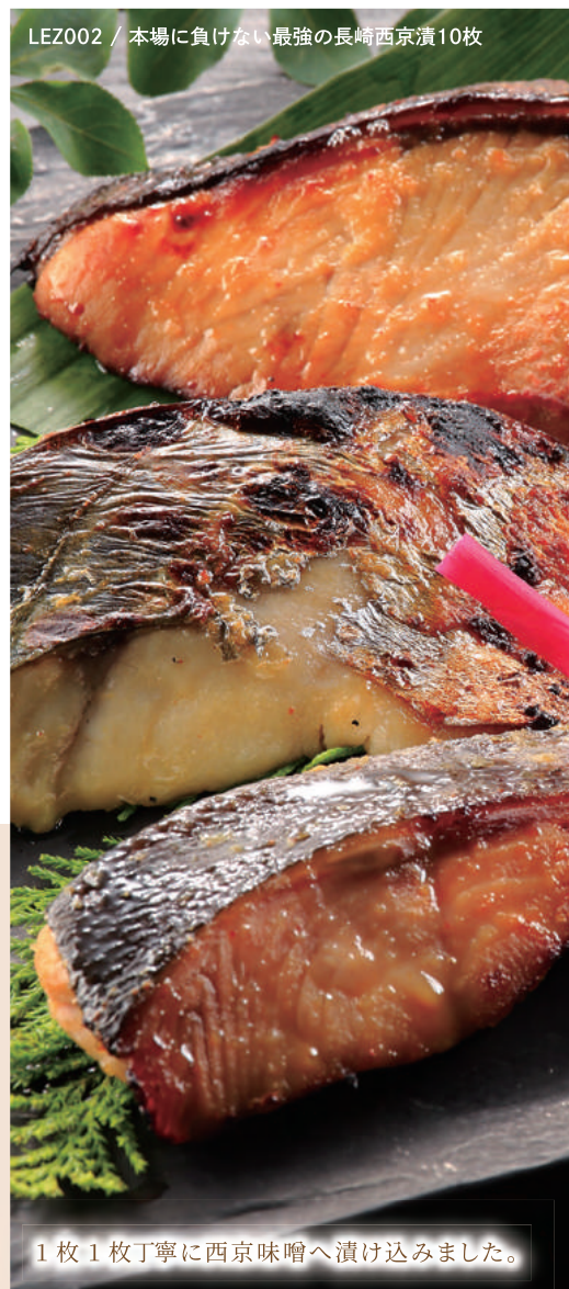
LEZ002 / 本場に負けない最強の長崎西京漬10枚