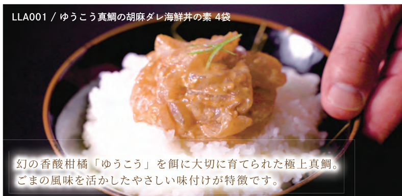
LLA001 / ゆうこう真鯛の胡麻ダレ海鮮丼の素 4袋

幻の香酸柑橘「ゆうこう」を餌に大切に育てられた極上真鯛。ごまの風味を活かしたやさしい味付けが特徴です。