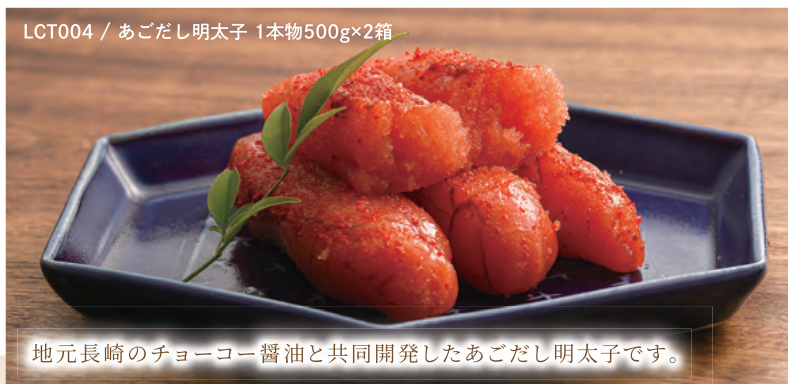
LCT004 / あごだし明太子 1本物500g×2箱

幻の香酸柑橘「ゆうこう」を餌に大切に育てられた極上真鯛。ごまの風味を活かしたやさしい味付けが特徴です。