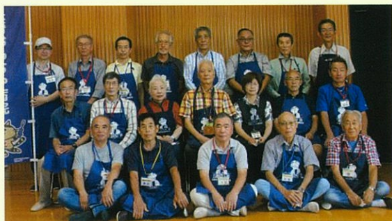
▲ドクター大集合！男性女性問わず、年齢も様々に活動中